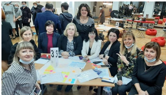
Районная стратегическая сессия 28.02.2021