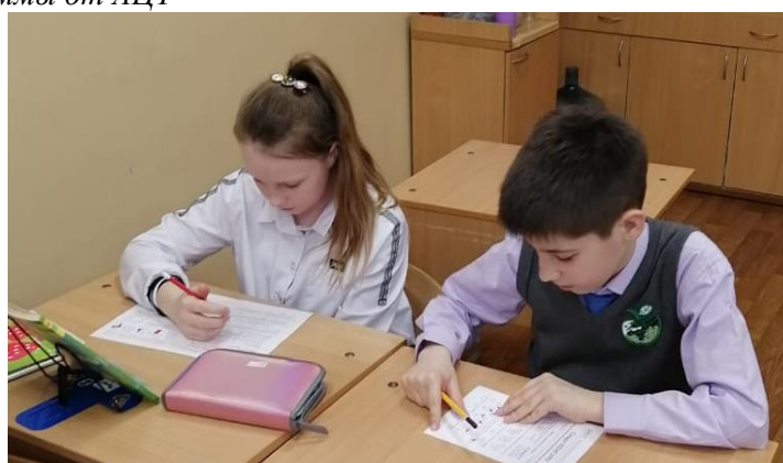
Олимпиада «Смартики», 3а класс