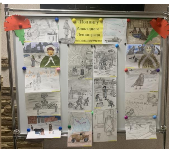
Акция «Блокада глазами детей»