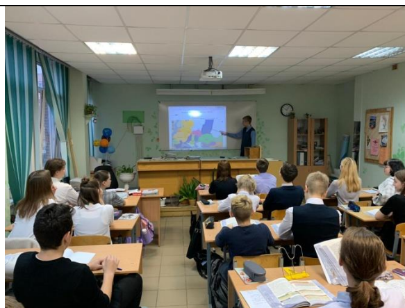
«Геакрон» на уроке истории