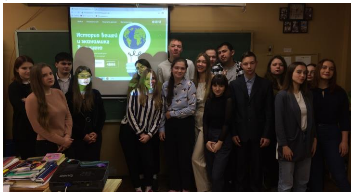
Урок «История вещей и экономика будущего», 11а класс

23.01. Проведение урока «История вещей и экономика будущего» (с использованием ресурса «Экоклас») в 11А – Евдокимов А.С.