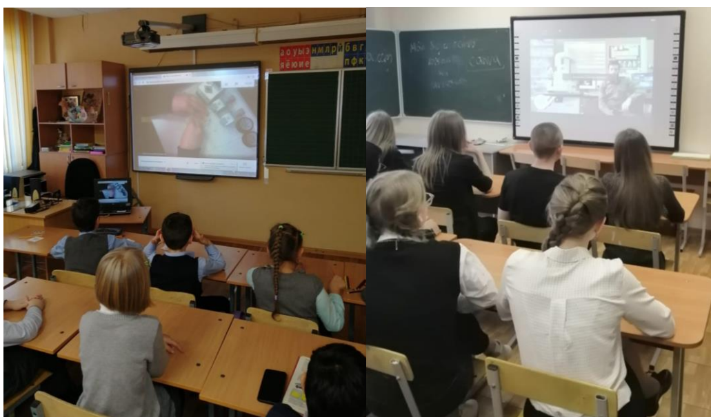
Реализация Модульной образовательной программы от АЦТ

22.01, 29.01.2021 Лекция «Военная история античного мира» в рамках «Университетской школы юного историка» (СПБГУ) (9а,9б,10а,11а) 20 участников