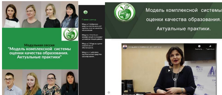
Районный семинар "Модель комплексной системы оценки качества образования. Актуальные практики"

28.01.2020 Районная стратегическая сессия «Командообразование: учимся работать вместе» (в рамках реализации Программы развития Невского района Санкт-Петербурга «От инновационных решений к опережающему развитию»).