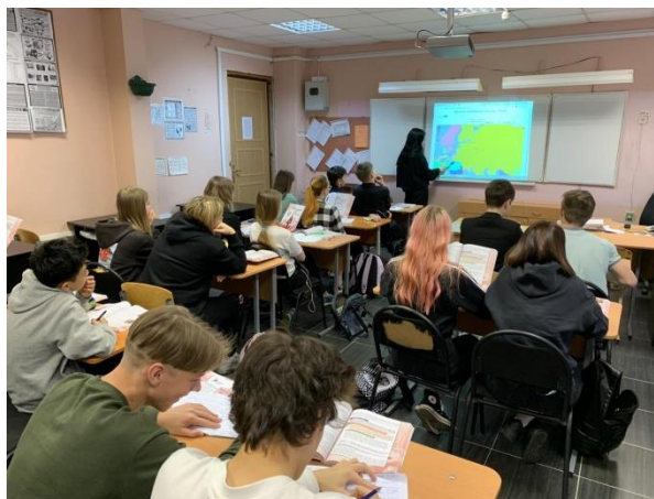
«Геакрон» на уроке истории