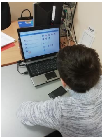
Участник проекта Цифровая школа от интерактивной образовательной платформы Учи.ру

26.01.2020 Корпоративное обучение "Организация и проведение дистанционного родительского собрания с помощью платформы ZOOM", 18 участников