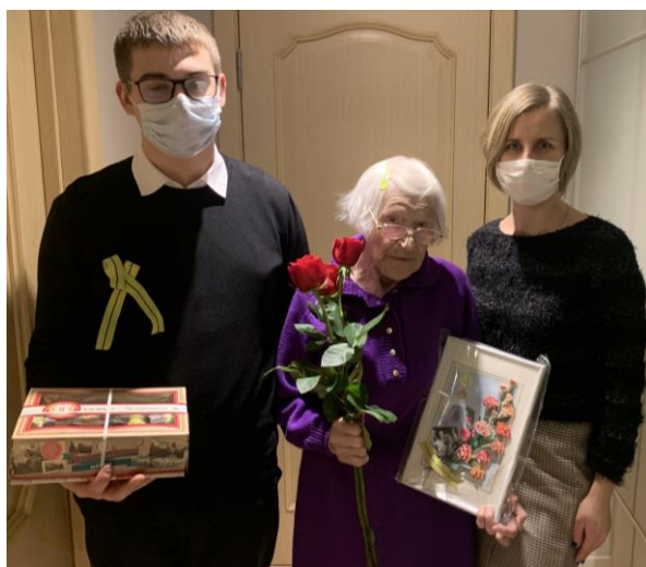
Акция «Поздравление ветерана...».

Цель: создание условий для воспитания сознательного отношения к собственному здоровью и жизни, формирование навыков безопасного поведения.